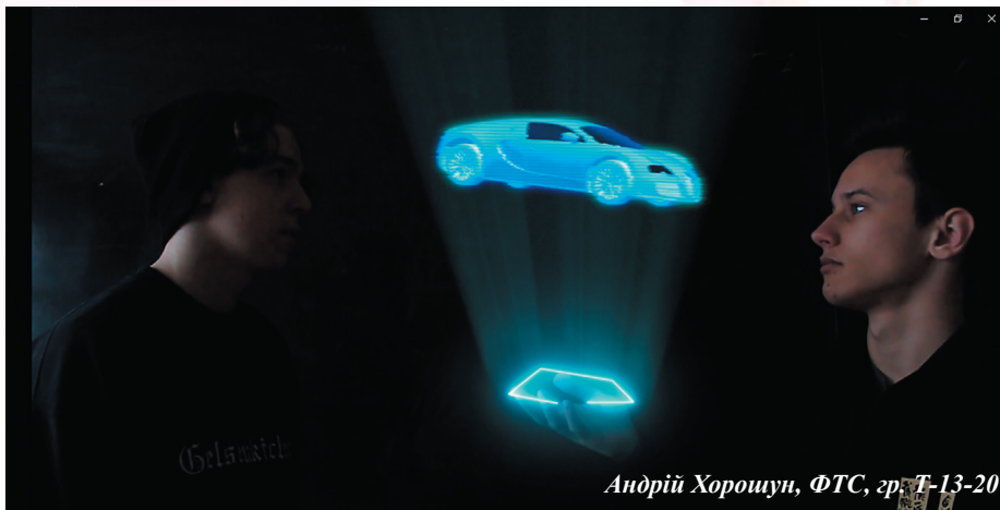
Андрій Хорошун, ФТС, гр. Т-13-20