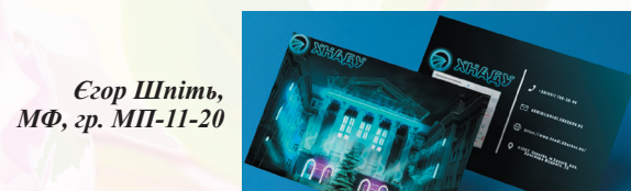
Єгор Шпіть, МФ, гр. МП-11-20