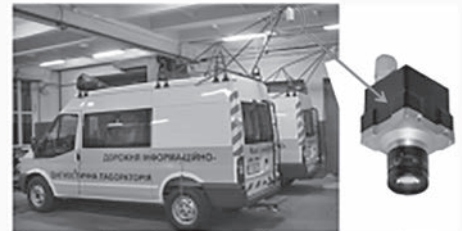
Система відеодіагностики (відеосканування) доріжніх покриттів «ОКО»

Загальний обсяг фінансування щодо розробок обладнання та нормативної бази з визначення та оцінки транспортно-експлуатаційних властивостей доріг за період – 7128700 грн.