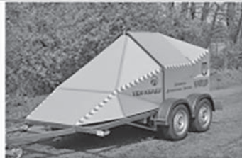
Установка динамічного навантаження УДН-ХНАДУ

КОНКУРЕНТНІ РОЗРОБКИ КАФЕДРИ БУДІВНИЦТВА ТА ЕКСПЛУАТАЦІЇ АВТОМОБІЛЬНИХ ДОРІГ ІМ. О. К. БІРУЛЯ