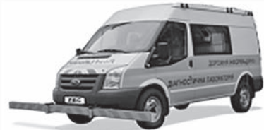
Лазерна вимірювальна система ЛВС